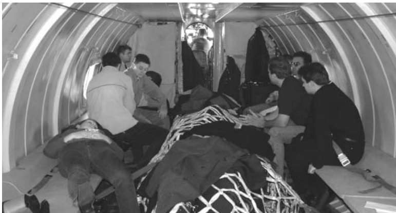
Cimbálová muzika na palubě „Anduly“

Náš pobyt se stal nejen pracovním ale také krásným výletem do míst, kam sahá i česká historie. Okouzlení jsme byli z městečka Konstanz, kde byl upálen Mistr Jan Hus a také z krásné přírody plné lesnatých strání se starobylými hrady.